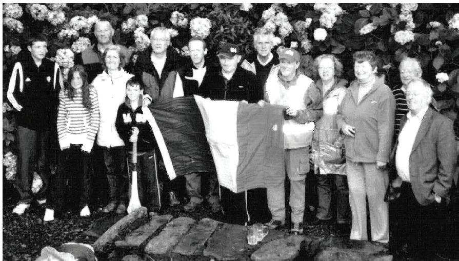
Fig. 2: Ag tosnú amach ar an gCamino de Santiago i 2007 ag Tobar Naoimh Shéamuis, Árd Uí bhFicheallaigh.

i sean mhainistir nó clochar a bhí athraithe d’oilithrigh, cuid acu fós i seilbh na mbráthar nó na mban rialta. Chodlaíos uair amháin in eaglais, faoin altóir. Chun traidisiún spioradálta an Camino a eispeiriú, d’éistean le haifreann na n-oilithreach i bpé áit a raibh a leithéid ar fáil sa tráthnóna, nó thugas cuairt ar eaglaisí ar an slí.