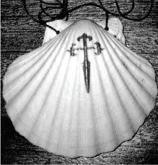
Fig. 3: Mo shliogán muirín a d'iompraíos ó Le Puy-en-Valay go Finisterre.

Tháinig feabhas mór ar an aimsir chomh maith – laethanta breátha gréine leis an meán-teocht thart ar 25° C don chuid is mó. Rud suimiúil a bhraitheas ó thús na slí oilithreachta ná an t-easpa ainmhithe nó éin fhiáine. Thuigeas níos déanaí san turas gurb é an modh feirmeoireachta a cleachtadh ba chúis leis sin. Níorbh fhéidir leis na héin nó na hainmhithe maireachtaint gan chlaí nó fál sceach sna feirmeacha móra oscailte.