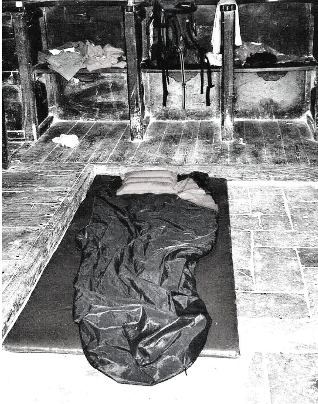
Fig. 4: Mo mhála codlata faoin altóir agus an lampa taibearnacail san sean-eaglais i nGranon.

na Montes de Orca, na sléibhte deireanacha roimh chathair Burgos agus tar éis uair go leith a chloig ag siúl trí limistéirí tionsclaíochta agus tithíochta, shroicheadar lár-chathrach Burgos agus an t-ionad lóistín, Alberg, taobh thiar den ardeaglais. Fuaireamar aifreann agus beannacht na n-oilithreach san ardeaglais. Bhí an aimsir go deas grianmhar nuair a dhreapamar suas don Parc del Castillo agus Caisleán Burgos, a scrios Napoleon i 1813. Dob é Burgos áit chónaithe El Cid san aonú aois déag. Tá a chorp curtha san ardeaglais agus feictear dealbh iontach in omós dó ar an Puente de San Pueblo i gceartlár