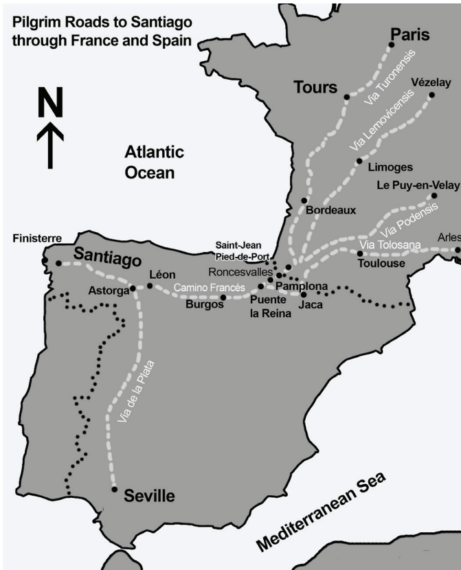
Fig. 1: Bealaí oilthreachta éagsúla tríd an bFrainc agus an Spáinn go Santiago de Compostella línithe ó Raju, A. 2010. A Cicero Guide: The way of Saint James, France . Cumbria.

Le himeacht aimsire, bunaíodh bealaí oilthreachta éagsúla. Sa bFrainc, mar shampla, bunaíodh ceithre cinn; tháinig na bealaí le chéile ag Sléibhte na bPiréin agus leanadar ar aghaidh, trí thuaisceart na Spáinne mar an Camino Santiago. Bunaíodh bealaí eile ó dheisceart na Spáinne, ón bPortaingéil, ón nGearmáin, srl (Fig. 1).